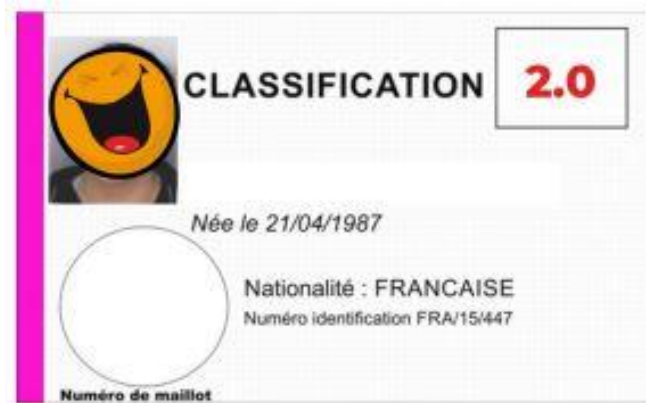
Carte Rose :