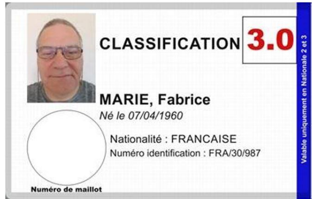
Carte Bleue :