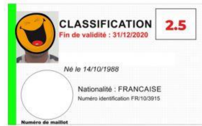
Carte Verte :

Donne une bonification de + 1,5 point à son équipe quand elle est en jeu.