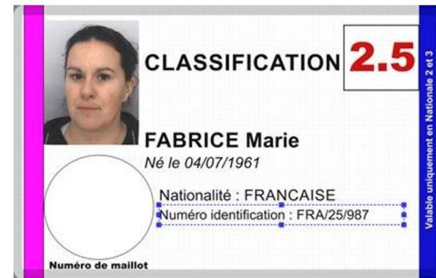
Carte Rose / Bleue :

Attention : seulement applicable en Nationale 2 et Nationale 3.